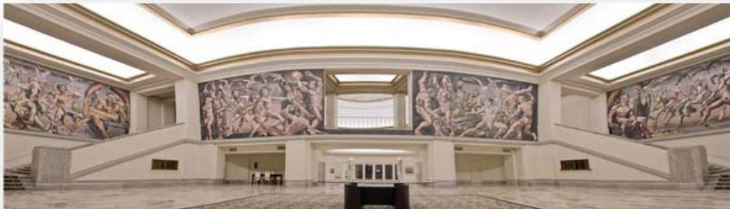
Hall de ingreso a la Sede - a la derecha: Secretaría de Acreditaciones, a la izquierda: Secretaría APSA

El Teatro del Hotel será utilizado para Actividades Especiales.